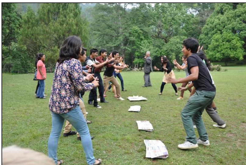
FOCUS-nuorten virkistätymispäivässä leikittiin paljon.