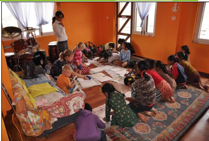
Pääsiäisaskartelua House of Hope –lastenkodissa.

oikein onnistuneet ja toivat pääsiäismielen kaikille! Toukokuun lopussa järjestimme get together – tyyppisen tapahtuman kaikille FOCUS-kumminuorillemme . FOCUS-järjestön kautta tuemme 22 kristityn nuoren jatko-opintoja. Matkasimme yhdessä bussilla Godawarin puistoon Kathmandun laakson reunalle. Ohjelmassa oli leikkiä, laulua ja ruokailu sekä kerroin heille Lähetysseurasta. Kaikille nuorille Focuksen kumppanina toimiva Lähetysseura ei ollut tuttu. He kuuntelivat tietoa hyvin innoissaan ja iloitsivat suomalaisista kummeistaan, jotka tukevat heitä myös rukouksin. Päivä oli todella onnistunut ja moni nuori kertoi todella viihtyneen ja saaneen uusia ystäviä. ”Tuleehan tästä joka vuotinen tapa!”, kysyi moni päivän päätteeksi.