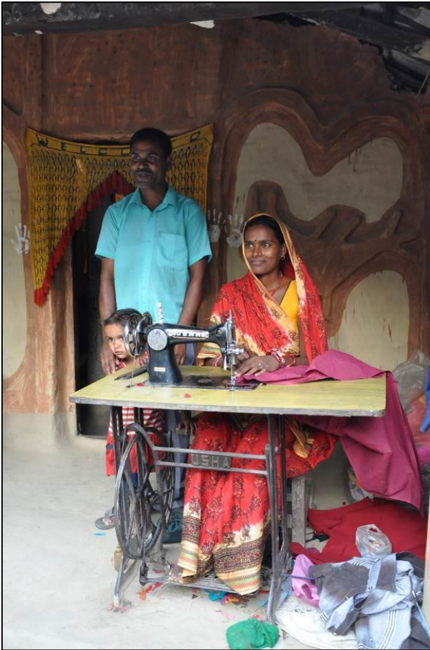
Assa kävi ompelijakoulutuksen ja saa nykyään elantonsa ompelemalla. Assa opetti myös miehensä ompelemaan, jotta kiireaikoina he voivat molemmat ommella. Koulutus kesti 6 kk ja ompelukone maksoi 60 €, johon hän sai lainan naistenryhmältä.

hoitopalkkiota ollenkaan, ainoastaan pienen voiton lääkkeistä, jolloin hänen päiväpalkkaksi tulee noin 3 €). Alueella toimii myös nykyään pieni koulu, jota kylän lapset käyvät ensimmäiset neljä vuotta. Lisäksi alueella toimii kymmeniä erilaisia säästöryhmiä ja yksi iso osuuskunta.