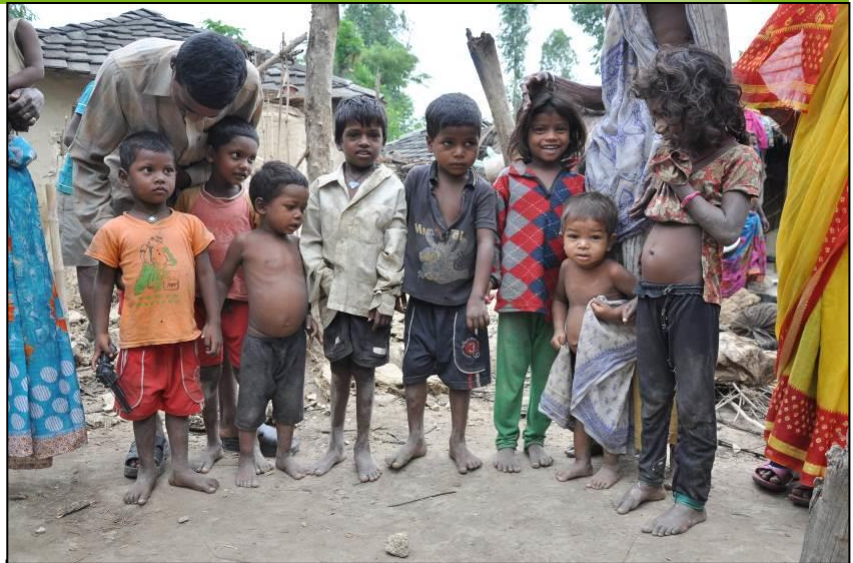
Netragunjien kylän lapsia.

tulee olemaan iso ongelma monsuunikauden alkaessa savimaalle rakennetuissa kevyissä savitaloissa. Myös muutamien kyläläisten kodit on tuhottu (osa asunnoista on yläkastisten vuokramaalla) ja tilaa uusille asunnoille ei kylässä enää ole. Suurin osa tytöistä ei voi vielääkään käydä koulua ja heidät naitetaan 12-13 vuoden iässä. Noin puolet kylän naisista edelleen peittää kasvonsa, ainakin osittain, vieraan tullessa